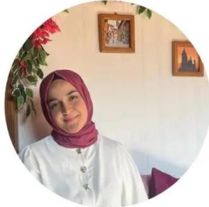
Başkan Sümeyye Bostan